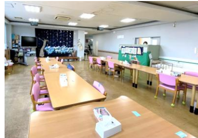
デイサービスフロア