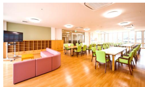
デイサービスフロア

白を基調とした建物は、存在感がありますが、館内は木目調の優しい雰囲気です。私たちの想いが、これからカラフルな花になり実を結ぶことを願っています。