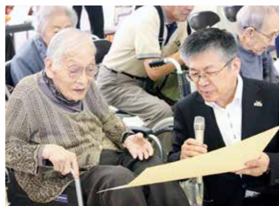
人生の大先輩にエールを(市長百才表敬訪問)