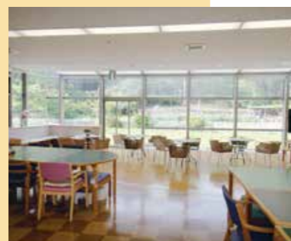
デイサービスセンター