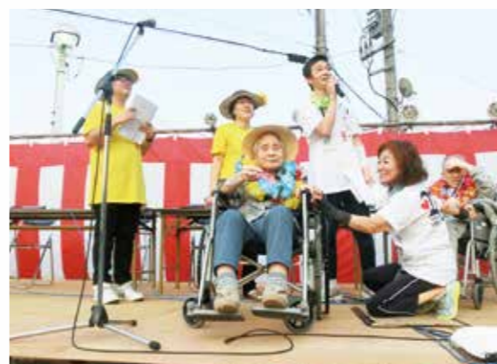
長寿のお祝いです(納涼祭)