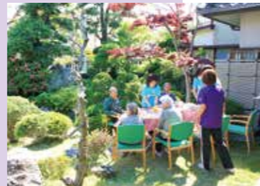
ガーデンパーティ