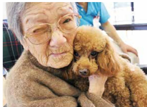
ナイスショット(動物ボランティア)