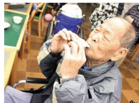
やっぱり出来立てはおいしいなあ(もちつき)