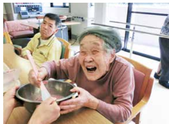
料理は私にまかせてね(料理クラブ)