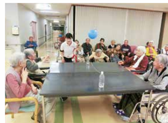
白熱のゲーム(運動会)