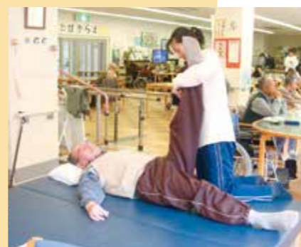
リハビリテーション