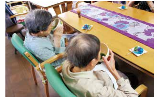
お好きなお茶碗でお抹茶をどうぞ