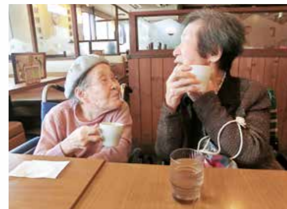
たまには外食もいいね(外出)