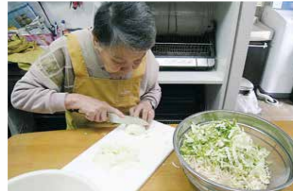
お手伝いもいろいろな運動になりますよ