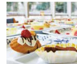
ケーキバイキング