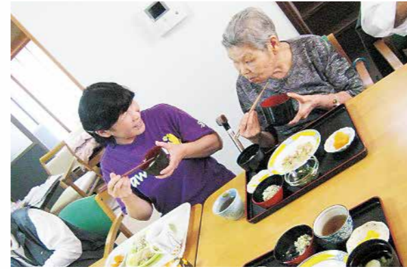
職員もご利用者様と一緒に楽しく食事