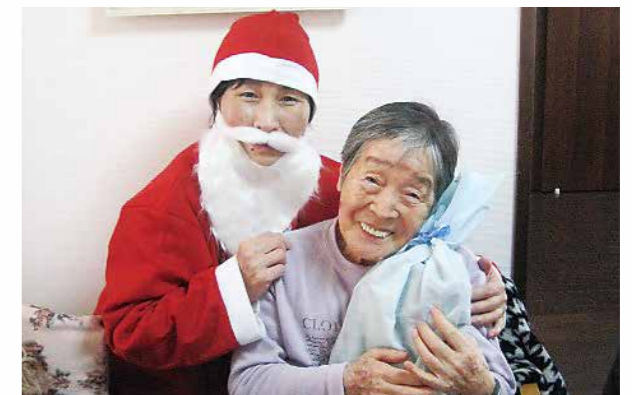
サンタから愛をこめて