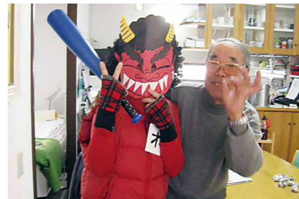
オニも仲間になってしまう心優しいご利用者様