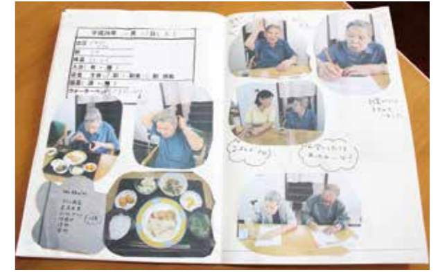
ご家族様、ご利用者様に大好評、特製写真入り連絡帳