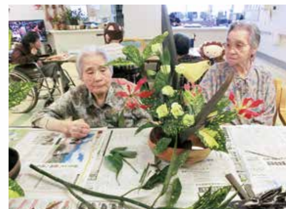
「昔、花嫁修業で習ったのよ」(華道クラブ)