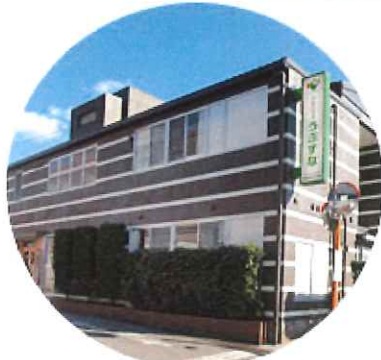
サービス付き 高齢者向け住宅 フルハウスうぶすな