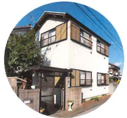
認知症対応型 共同生活介護 シルバーハウス寿楽