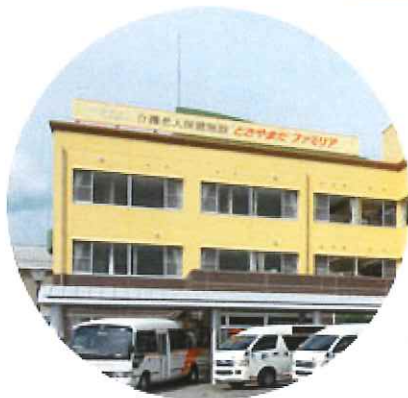
介護老人保健施設 とさやまだファミリア 通所リハビリテーション