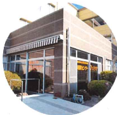
居宅介護支援事業所 相談センターファミリア