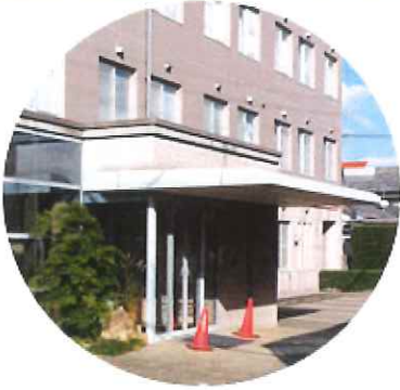
楠目循環器科内科・眼科