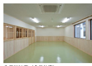
作業訓練室 (多目的室)